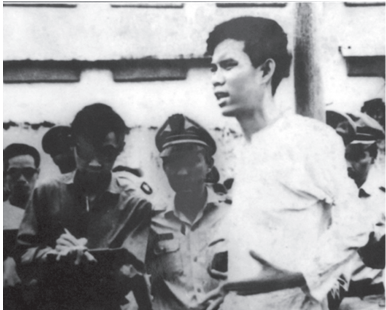
Anh Nguyễn Văn Trỗi trong giờ phút ở pháp trường.

“Có những phút làm nên lịch sử Có cái chết hóa thành bất tử Có những lời hơn mọi lời ca Có con người như chân lý sinh ra