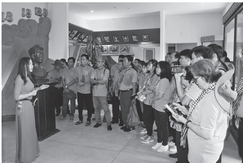
Các thành viên Đoàn hành trình thứ 6 nghe giới thiệu về cao trào 1930 - 1931 tại Bảo tàng Xô viết Nghệ Tĩnh, thành phố Vinh, tỉnh Nghệ An.

dâng hoa tại Khu tưởng niệm Liệt sĩ Thanh niên xung phong toàn quốc và 10 nữ anh hùng thanh niên xung phong Khu di tích Ngã Ba Đồng Lộc; dâng hương, dâng hoa tại khu di tích anh hùng Lý Tự Trọng, xã Việt Xuyên, huyện Thạch Hà; tham quan hồ Kẻ Gỗ, dâng hương tại đền thờ Tổng Bí thư Lê Duẩn. Tại Quảng Bình, các đại biểu thấp hương tưởng niệm tại khu mộ Đại tướng Võ Nguyên Giáp, tham quan di tích thành cổ Quảng Bình, dâng hương tại tượng đài Mẹ Suốt bên dòng Nhật Lệ, sau đó đi thuyền ngắm dòng sông Son, chiêm ngưỡng vẻ đẹp động Phong Nha - Kẻ Bàng...